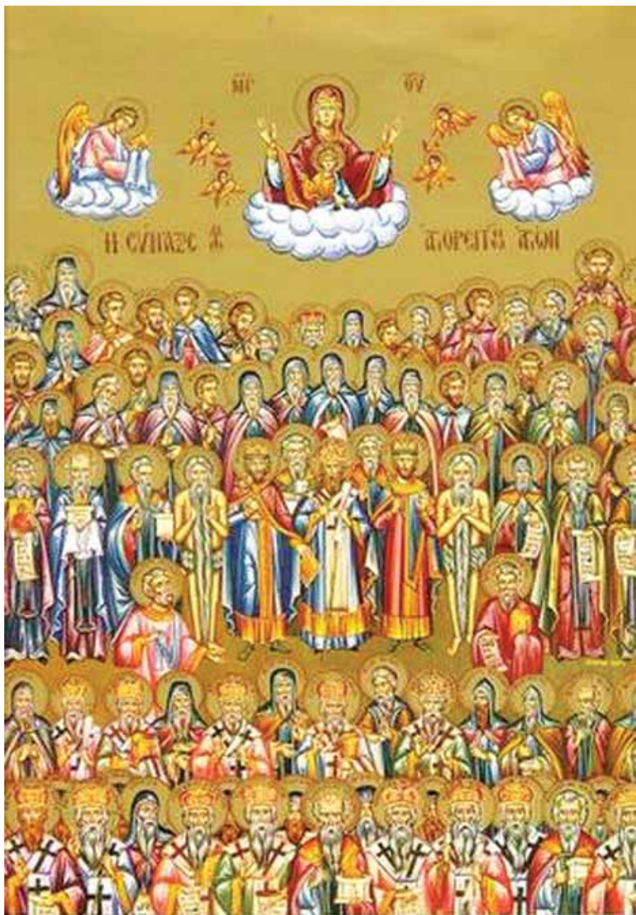
Ікона всіх святих, що в Україні просіяли