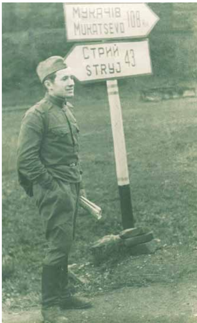
Василь Пишний, 1961 рік