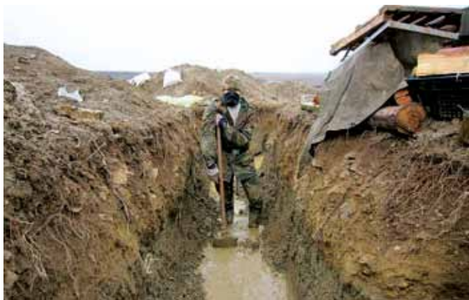
На фото типова позиція на передовій осені і зими 2014-го року. 43 ОМПБ.

Було одне бажання - сказати "сука, закрій рот" і вивезти в підрозділ на передову. Можливо, допоможе.