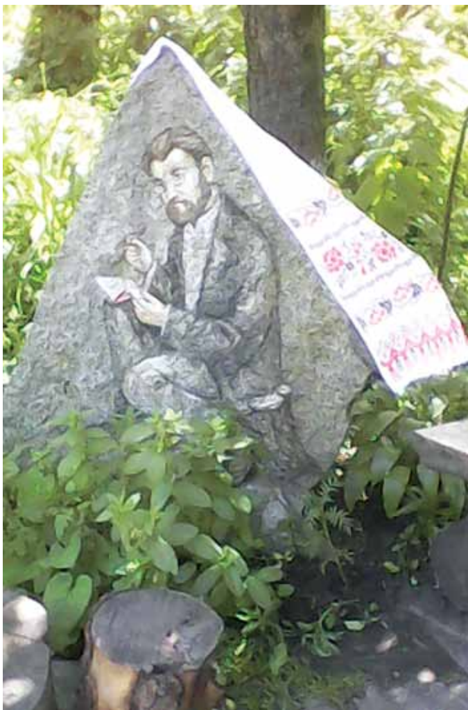
Пам'ятний камінь Івану Манжурі у дворі Музею