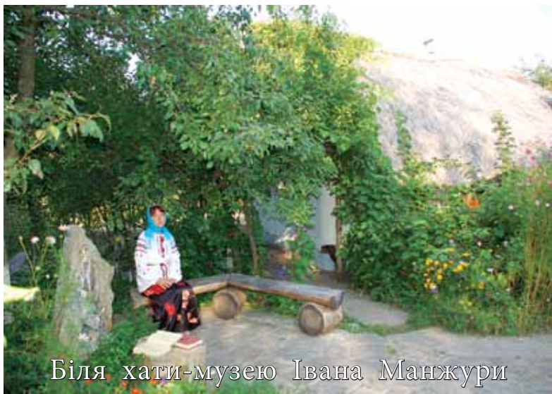
Біля хати-музею Івана Манжури