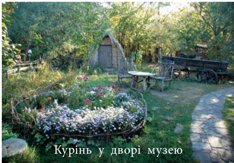
Курінь у дворі музею