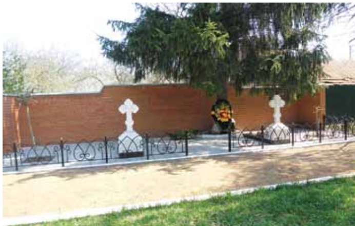
Могила Миколи Скліфосовського, Яківці (Полтава)