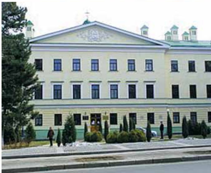
Лікарня ім. Мечникова в м. Дніпро

явище фагоцитозу, за що через 25 років одержав Нобелівську премію. Мечников іронізував: «Нобелівська премія, як чарівна паличка, вперше відкрила світові значення моїх скромних робіт».