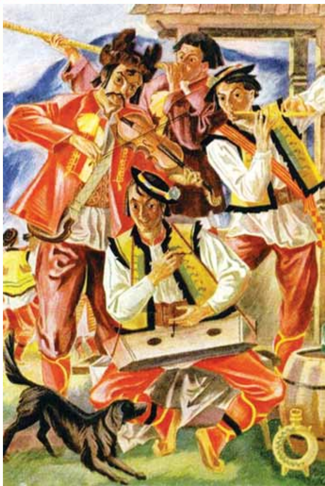
Гуцульські музики. Святослав Гординський