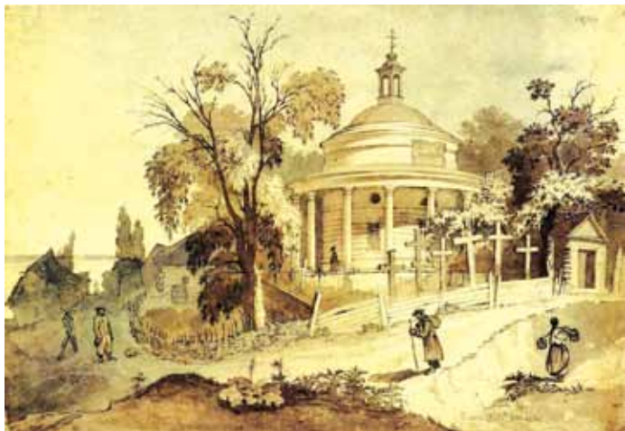
Оскольдова могила, мал. Т. Шевченка

Київського (882). Прп. Агапіта, лікаря Києво-Печерського (1095).