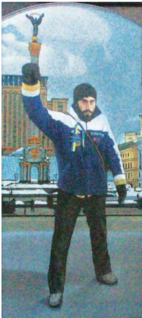
Самвел Нігоян, Герой України