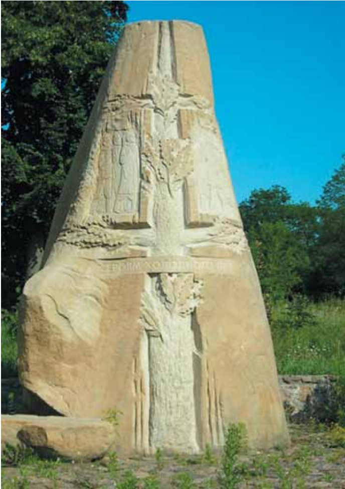
Пам'ятний знак «Героям Холодного Яру» в с. Мельники Чигиринського р-ну Черкаської обл.